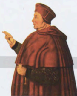
הקארדינל וולסלי רוכש את המפטון קורט ויוצר בו גן כדי להרשים את הנרי השמיני