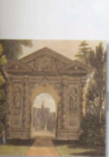
מוקם הגן הבוטני הראשון באנגליה באוניברסיטת אוקספורד