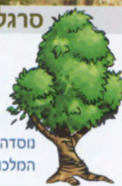
נוסדה החברה המלכותית לגנים