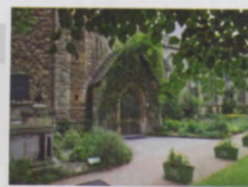
מוזאון הגנים הבריטי נפתח בלמבת האז