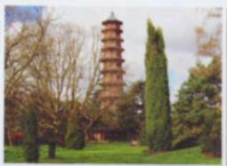
גני קיו מוכרזים כאתר מורשת עולמית של יונסקו

מוזאון הגנים נטל חלק חשוב בדיון הציבורי שהתנהלה בהנהגתו של ראש העיר בוריס ג'ונסון על פרויקט התשתית הירוקה של לונדון ופרויקט הגר'ד הירוק לעיר. מסמך העבודה שהופק לצורך קידום הנושא מיועד להמשיך את העבודה החשובה שנעשת במזרח לונדון ולחשוף את התכניות לשאר חלקי הבירה. על מנת שהדיון והקולות בנושא הזה לא יירדו מסדר היום הציבורי, הצליחו אנשי מוזאון הגנים להבטיח תקציבים ממשלתיים ועירוניים לארגונים מהמגזר השלישי, שימשיכו את עבודת ההסברה והובלת מקבלי ההחלטות. לאחרונה הם שיתפו פעולה עם המכון לעיצוב הנוף והציגו הצעה משותפת לתיקוני חוק שיבטיחו כי כל פרויקט בנייה חדש יכלול מרחב לגידולי גינה לכל הדיירים.