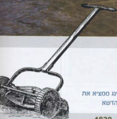
אדווין בדינג ממציא את מכסחת הדשא