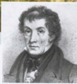
ג'ון לודון מפרסם את אנציקלופדיית הגינון