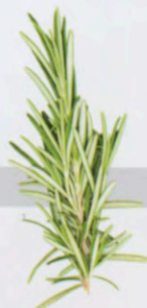
הרוזמרין מוצג לראשונה על ידי אשתו של אדוארד השלישי, פיליפה מהיינולט