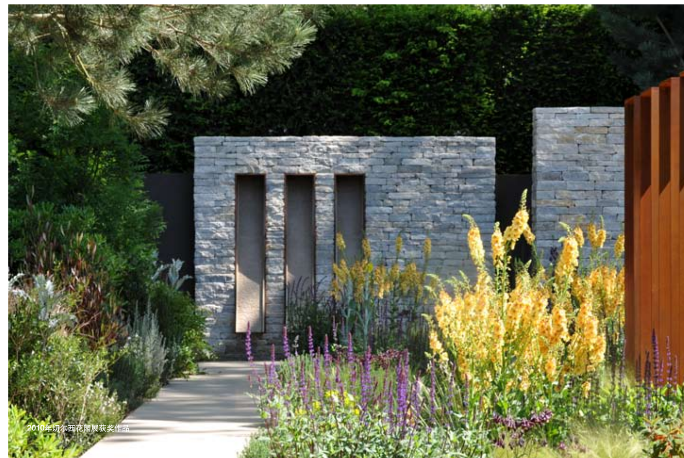
2010年切尔西花园展获奖作品