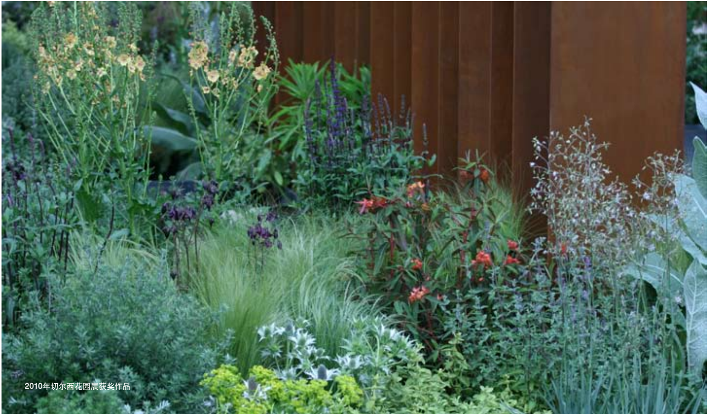
2010年初尔西花园展获奖作品

出版的成功, 让Andy得到了英国甚至国际设计界的认可, 同时为他赢得了众多电视媒体报道的机会。他第一次出现在电视上是BBC播出的一个乡村花园设计的系列片, 不过最让他声名鹊起的是在一年一度的伦敦切尔西花园展上获得的殊荣, 那