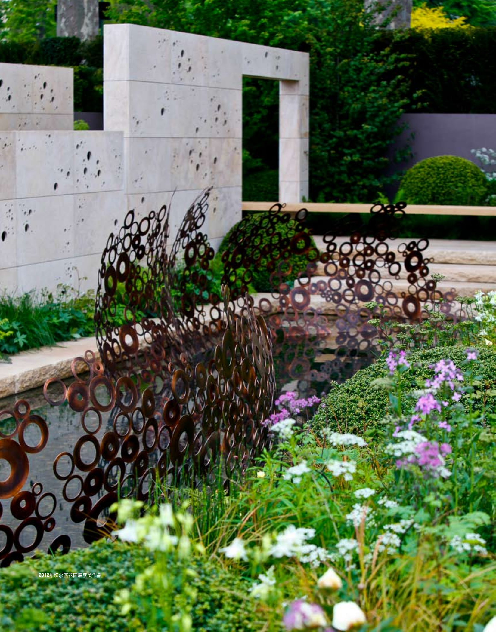
2012年初尔西花园展获奖作品