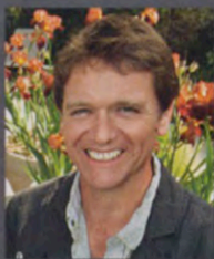
Автор проекта: Энди Стёрджен