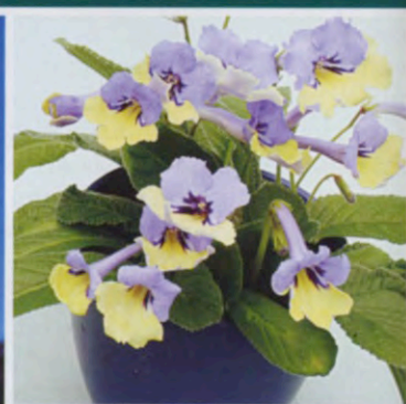
Каждый год на выставке в Челси проходят презентации новых сортов растений. Стрелтокарпус 'Harlequin Blue', представленный питомником Dibley, признан растением года (сверху).