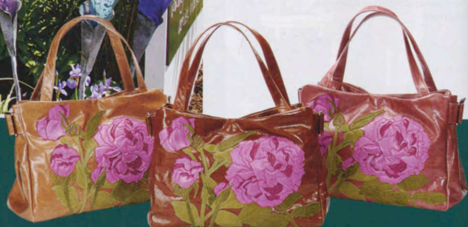
Эксклюзивные сумки от дизайнера Сюзанны Хантер стали официальным аксессуаром Chelsea Flower Show 2010. Характерная деталь каждой — тисненая роза 'Reine des Violettes' из кожи наппа.