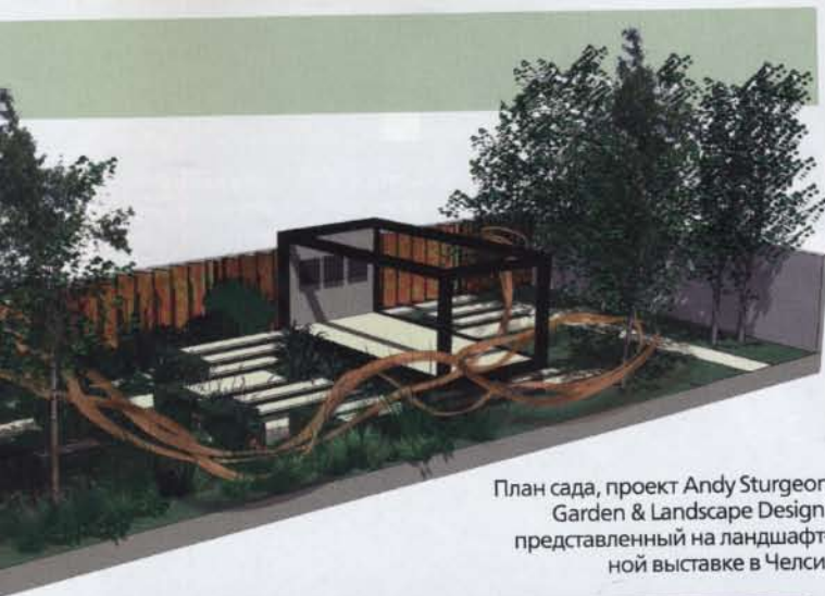
План сада, проект Andy Sturgeon Garden & Landscape Design, представленный на ландшафтной выставке в Челси.

Ступеньки и дорожки в этом саду выложены светлыми известняковыми плитами. Вдоль тропинки (внизу) высажены травы-многолетники: анемантеле тростниковидный ( Anemanthele lessoniana )