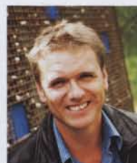
Автор проекта: Andy Sturgeon

Пентхаус 10-этажного дома имеет две террасы. Северная в течение дня остается в тени, отбрасываемой соседним зданием, на южной же постоянно светит солнце. Временами на террасах гуляет ветер. Большие окна выходят на красивый сад.