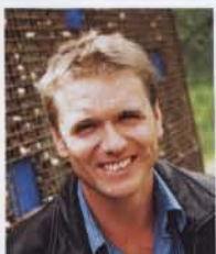
Автор проекта: Andy Sturgeon

В апреле в рамках выставки «ДОМ и САД 2008» в Москве пройдут мастер-классы известного ландшафтного дизайнера Энди Стэджена. Он поделится со специалистами секретами построения композиций. Один из постоянных проектов Энди — сад, посвященный борьбе с онкологией.