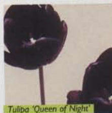
Tulipa 'Queen of Night'