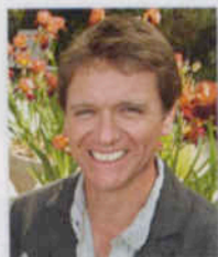
Автор проекта: Энди Стёджен

Элегантный сад площадью 70 м 2 создан на крыше дома. Смелый проект с выразительными формами сочетает в себе огонь и воду, пластик и дерево, вечнозеленые и экзотические растения.