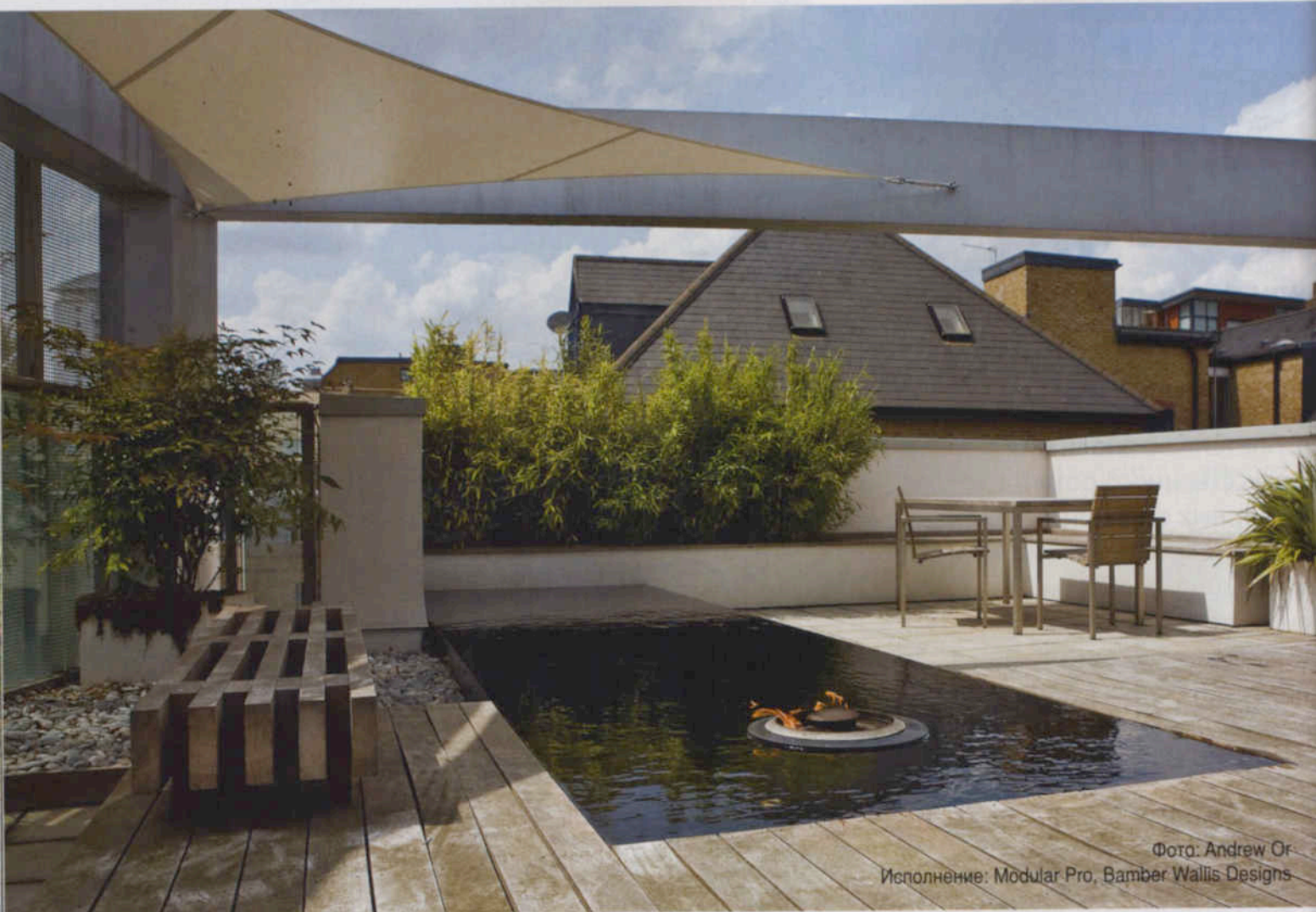
Исполнение: Modular Pro, Bamber Wallis Designs